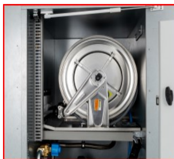
Rustfri slangetromler m/selvoprul